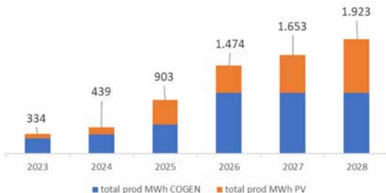
Production électricité Comensia en MWh

Comme expliqué sur la page précédente, les cogénérations sont des moteurs qui produisent à la fois de la chaleur (pour le chauffage) et de l'électricité, beaucoup d'électricité ! Comensia a commencé par une petite unité de production qui ne générerait que peu d'électricité, mais depuis 2024, il y a déjà 15 installations. En 2028, nous prévoyons qu'il y en aura 36 ! Toutes ces toitures et ces chaufferies équipées produisent actuellement un tiers du courant dont on a besoin. À l'avenir, Comensia produira plus d'électricité que les 1 200 MWh dont elle a besoin pour ses communs... Ceci permet de garder un prix correct pour l'électricité des occupants !