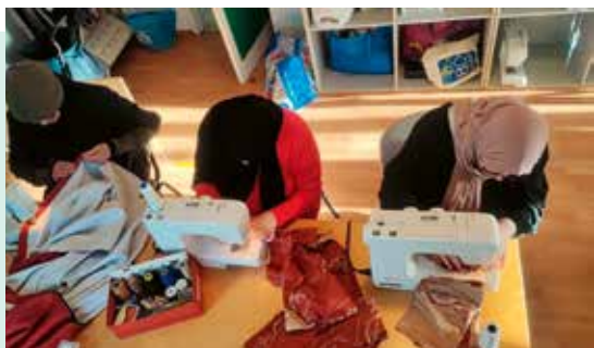
Onze huursters-coöperanten uit Laken die deelnemen aan de naaiworkshop van woensdag.

Sinds het gemeenschapshuis een keuken installeerde, bied ik ook kooklessen aan want ik werkte vroeger in de horeca. De deelnemers leren er eenvoudige gerechten te bereiden met recepten uit de hele wereld en met ingrediënten die in iedere keuken en koelkast te vinden zijn. Om voedselverspilling tegen te gaan, is het belangrijk gerechten te bereiden die toegankelijk en goedkoop zijn. Voorts geef ik ook advies over hoe een mooie tafel te dekken.