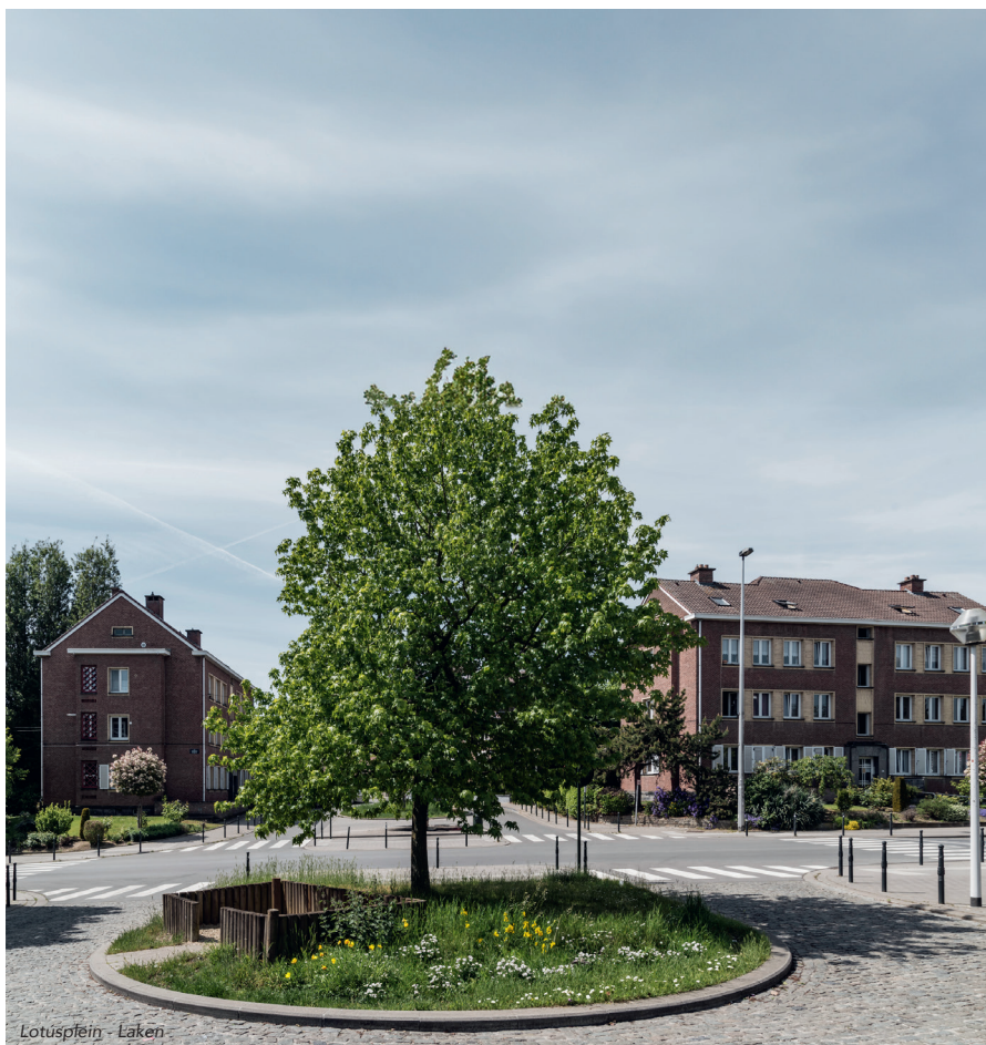
Lotuspfein - Laken