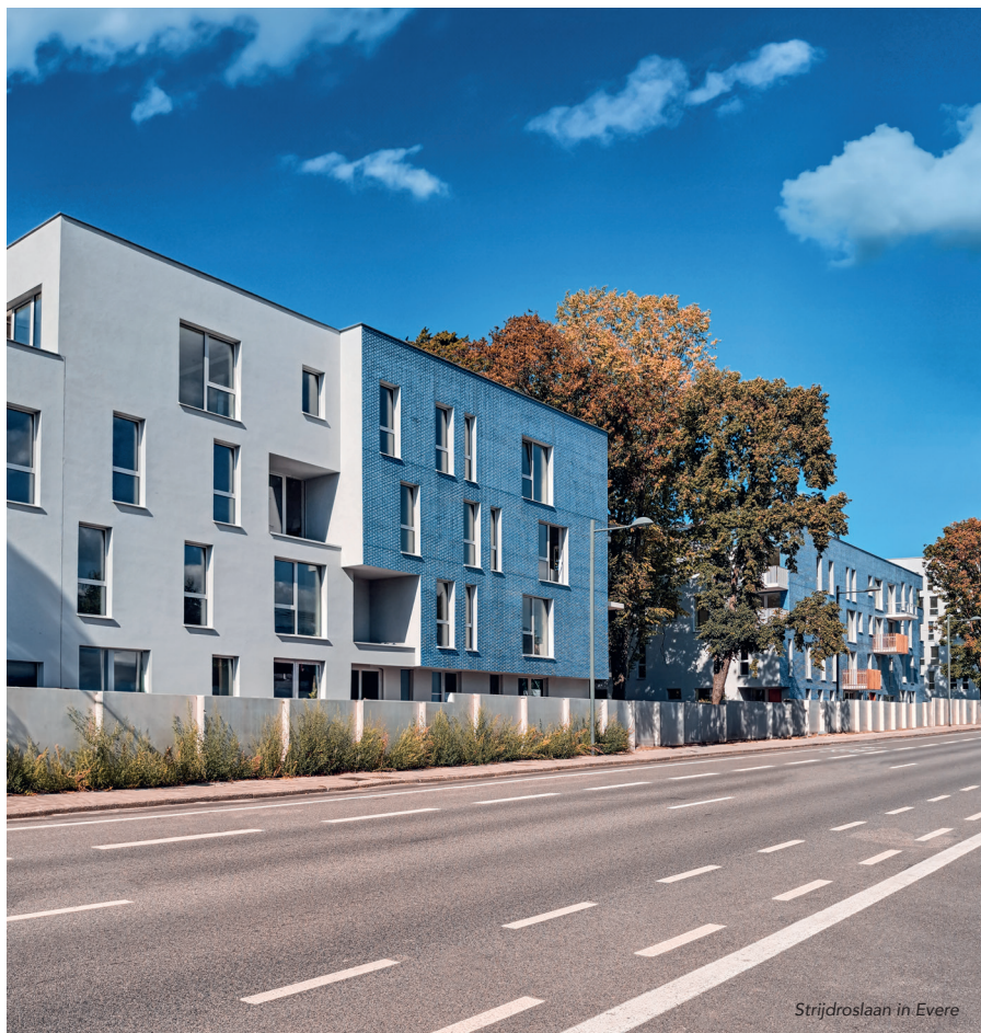
Strijdroslaan in Evere