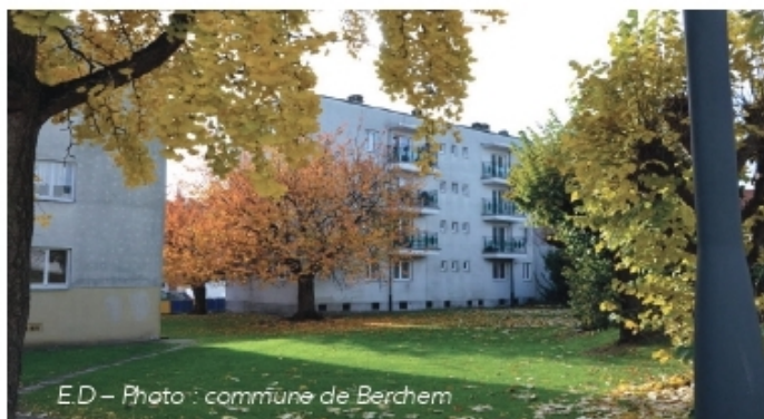
E.D – Photo : commune de Berchem

La Commune de Berchem-Sainte-Agathe a inauguré (en avril) la nouvelle antenne de quartier pour le Contrat de Quartier Durable de la Cité Moderne.