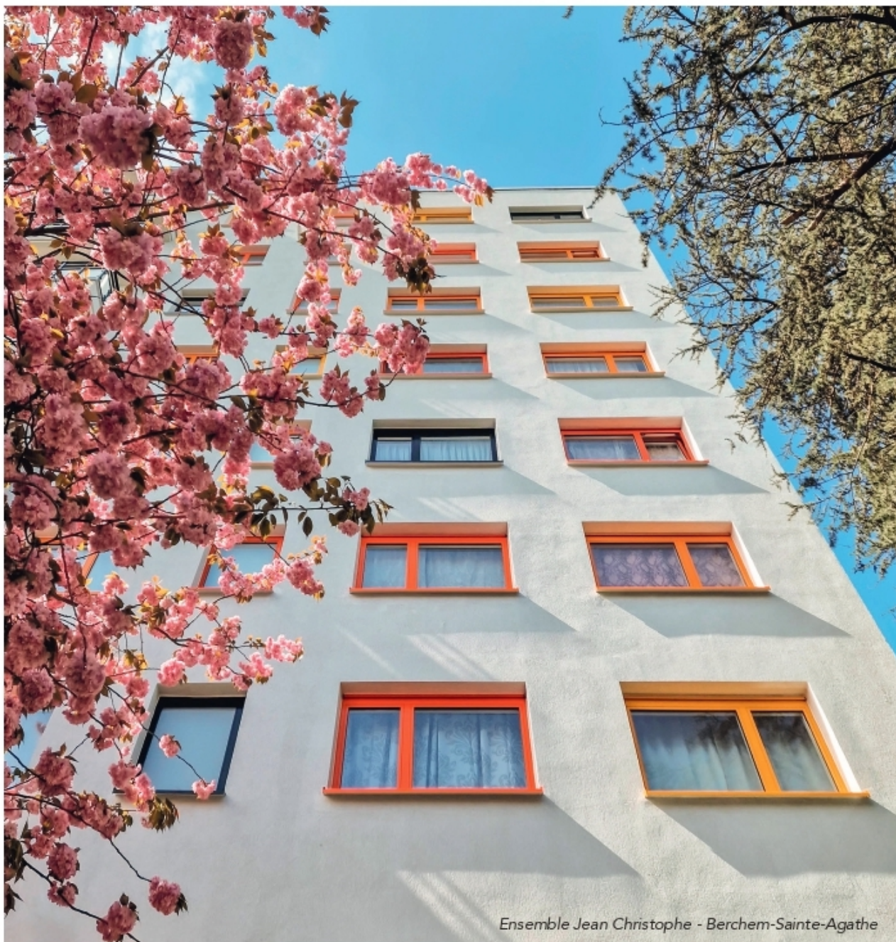
Ensemble Jean Christophe - Berchem-Sainte-Agathe

Le magazine d'information de Comensia - coopérative de locataires