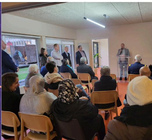
Inauguration de l'antenne de proximité du site Hundereveld – 12/10/2022

Lors de la phase d'étude, une attention particulière a été introduite dans ces projets pour que ces espaces soient à la fois agréables et fonctionnels. Le choix des matériaux, des couleurs et des mobiliers permet à toute personne passant la porte des lieux de se sentir à son aise. Un grand merci aux équipes techniques qui ont œuvré à ces réalisations.