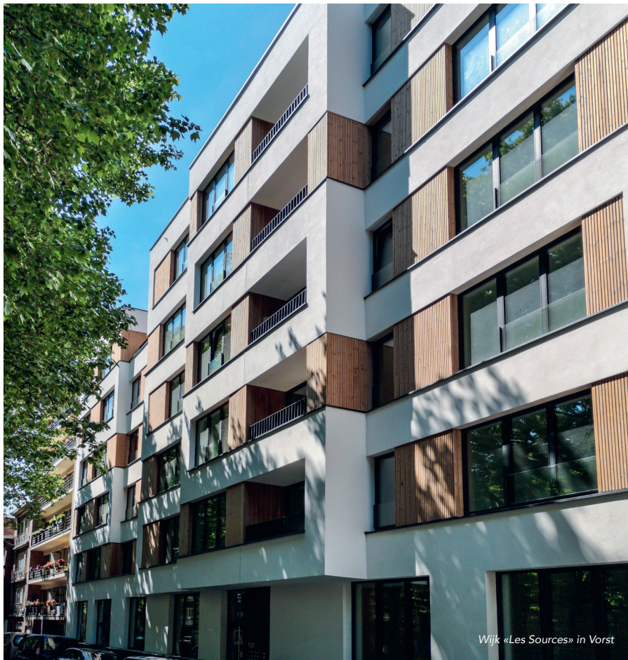
Wijk «Les Sources» in Vorst