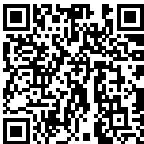
Comensia's YouTube-kanaal "Comensia Officiel"