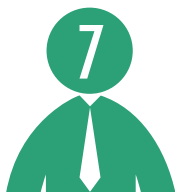
Administrateurs représentent les associés-locataires

Comensia est administrée par un Conseil d'administration comprenant entre 8 et 15 administrateurs.