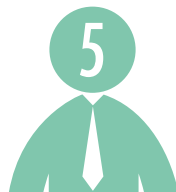
Administrateurs représentent les associés-particuliers