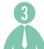
Administrateurs représentent les associés-pouvoirs publics